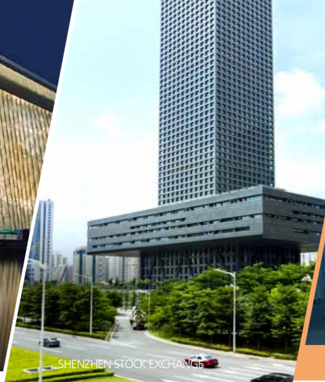
SHENZHEN STOCK EXCHANGE