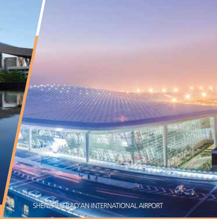
SHENZHEN BAO'AN INTERNATIONAL AIRPORT